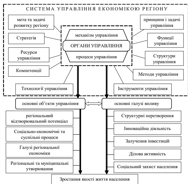
Рис. 1. Концептуальна модель системою управління економіки регіону

загальний регулюючий вплив, але у той же час зобов'язаний вирішувати ряд внутрішніх проблем і питань самозабезпечення і самодостатності.