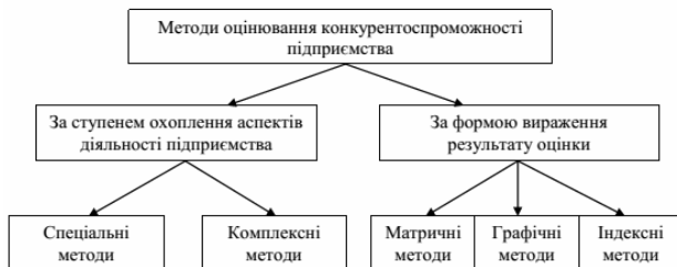
Рис. 1. Методи оцінювання конкурентоспроможності підприємства [1]

За ступенем охоплення аспектів діяльності підприємства методи оцінювання можна згрупувати як спеціальні та комплексні. Спеціальні методи – такі методи, які дозволяють виконати оцінювання конкурентоспроможності підприємства за окремими аспектами його діяльності – виробничий, фінансовий, маркетинговий, інноваційний тощо. Комплексні методи засновані на комплексному підході до виконання оцінювання конкурентоспроможності підприємства.