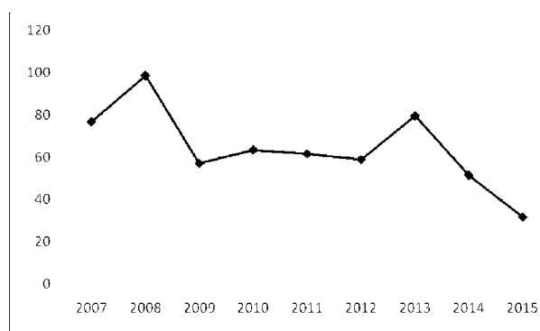
Рис. 2. Щільність страхування, дол США

98,54 дол. США, у 2015 році одна особа в Україні в середньому на страховий захист витратила 31,78 дол.США, або 694,08 грн.на рік.